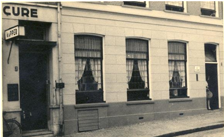
Nijmegen, Smetiusstraat 9, ergens voor de oorlog gefotografeerd. Er was toen een dansschool in gevestigd.

Ook het onderwijs werd niet met rust gelaten. Al in februari 1941 waren alle Joodse studenten van de universiteiten gestuurd. Eerder al, in november 1940, werden alle Joodse leraren uit het onderwijs verwijderd. Vanaf 4 juni 1941 mochten Joodse leerlingen niet meer deelnemen aan het schoolzwemmen. 5 Na de zomervakantie moesten ze de scholen verlaten en werden ze - zo goed en zo kwaad als dat ging - ondergebracht in aparte Joodse scholen. Er werden gaandeweg in het hele land 62 lagere scholen (waarvan 18 in Amsterdam), 18 ULO-scholen, 12 lycea, 1 hbs en vijf Nijverheidsscholen opgericht. 6 In Nijmegen werd alleen een lagere school voor Joodse kinderen opgericht.